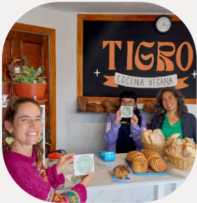
Tigro Cocina Vegana

Lanzamos el “Sello del Buen Vivir”, un distintivo que reconoce y promueve el compromiso de los locatarios o negocios de la localidad con una vida plena, equilibrada y sostenible.