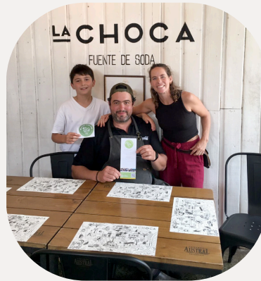
La Choca Fuente de Soda