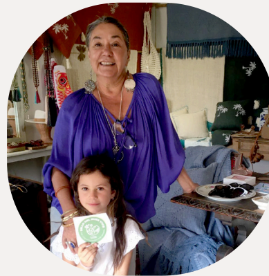
Loreto Vuskovic Decoración