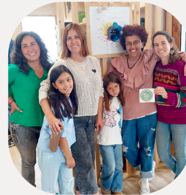
Pura Tinta Impresiones